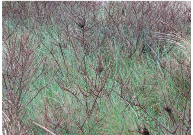
Figuur 4. Kaalgevreten duindoorn met overblijfsels van nesten van bastaardsatijnrups

De jonge rupsen maken een nest van spinsel. In dit spinsel brengen zij de winter door. In het voorjaar gaan ze verder met hun ontwikkeling en zullen nog spinsel aanmaken als schuilplaats voor de nacht. Uiteindelijk kunnen waardplanten kaalgevreten worden (Figuur 4).