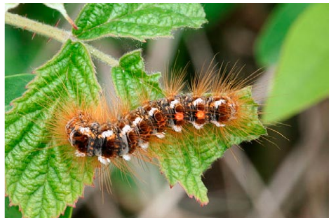
Figuur 5. Bastaardsatijnrups

De rupsen in het vijfde stadium hebben twee opvallende oranje "wratten" bovenop en aan beide zijden witte toefjes over het gehele lijf. Naast de lange lichtbruine haren hebben de rupsen borstels met kleine donkerbruine brandharen van 0,2-0,3 mm lang en niet zichtbaar met het blote oog (Figuur 5).