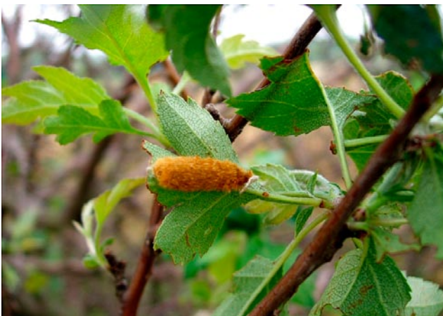
Figuur 3. Eipakket van bastaardsatijnvlinder aan onderzijde van meidoornblad

De eieren worden door de vlinders afgezet in pakketten, die bedekt worden met de haren uit het achterlijf. Deze pakketten bevatten gemiddeld 200 tot 400 eieren. De eieren worden afgezet aan de onderzijde van bladeren of op takjes (Figuur 3).