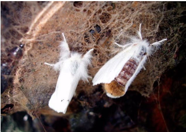
Figuur 2. Bastaardsatijnvlinder met beharing aan het uiteinde van het lijfje.

De vlinder is wit zonder specifieke tekening op de vleugels. Opvallend is het achtereind van het lijfje. Op dit lijfje, en dan met name bij de vrouwtjes, zit een grote hoeveelheid oranje-bruine gekleurde haartjes (Figuur 2). Het mannetje valt op door zijn gevederde antennen, waarmee hij de lokstof opvangt van de vrouwtjes.